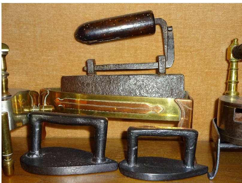
Wat doen met een verzameling van 500 strijkijzers ... ?

20-30 jaar geleden kochten de professionele postzegelhandelaren de mooiste stukken aan 10% van de catalogusprijs en verkochten die aan 50%. Vandaag verkopen sommige handelaars hun stukken aan 10% van de catalogusprijs ! Internetverkopers zoals Ebay en Delcampe zijn ook verzadigd.