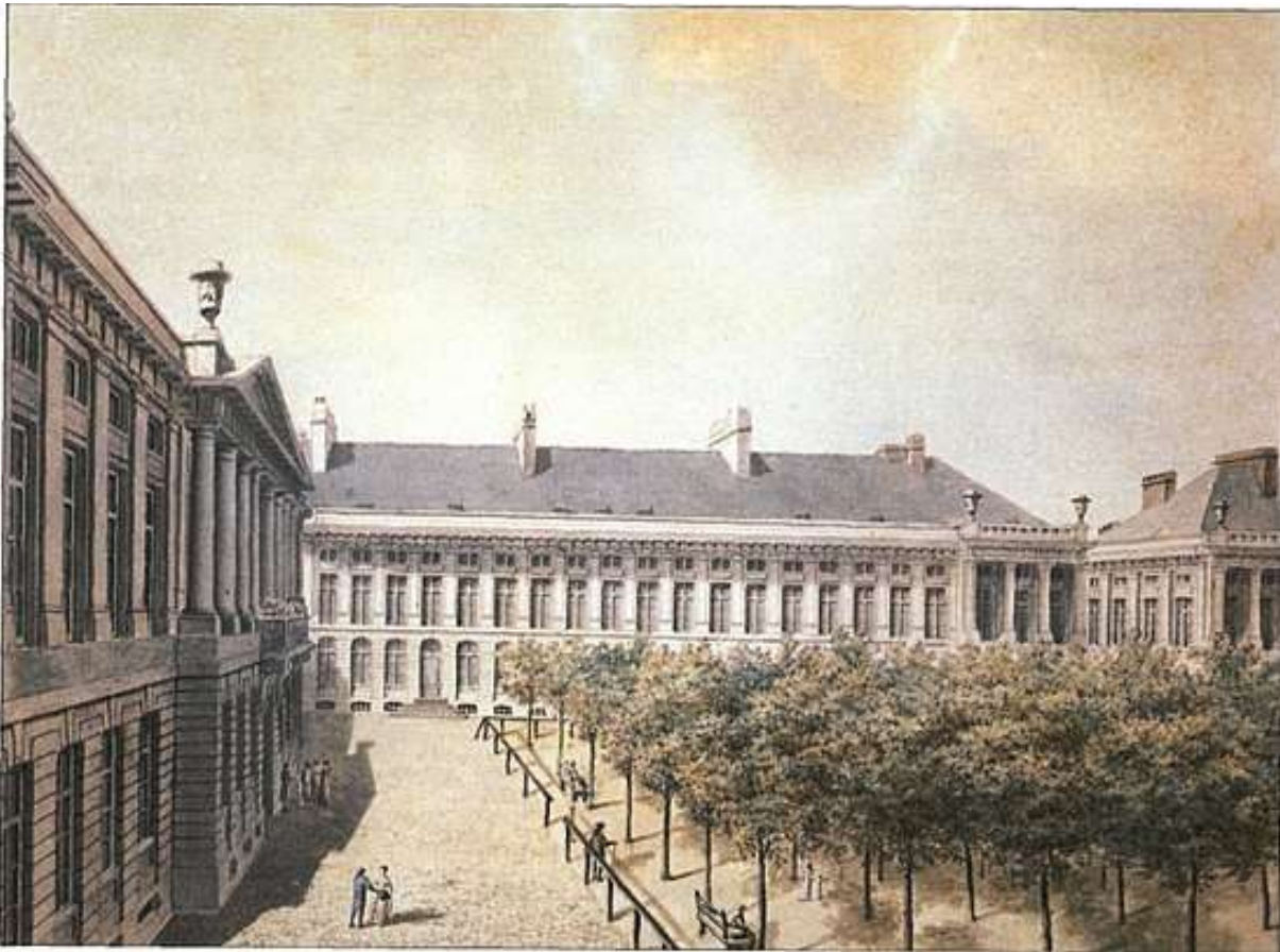
Het Martelarenplein beplant met lindebomen, 1810

De inrichting van het plein veranderde dikwijls in de loop der eeuwen. Oorspronkelijk was het plein geplaveid en leeg, zoals te zien op gravures uit het eind van de 18 e eeuw. In 1802 werden er in het midden lindebomen geplant.