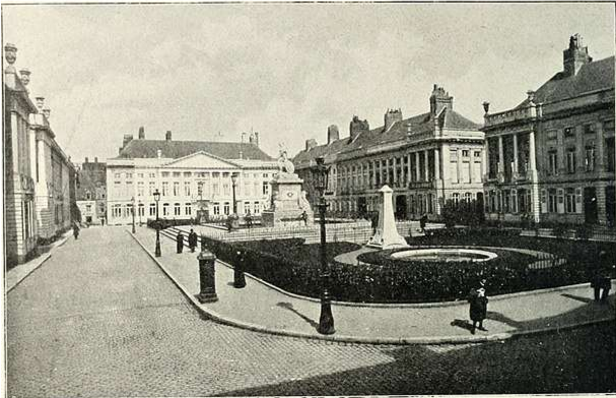
Het plein in 1910. Let op de bloemperken en de waterbekkens langs beide zijden van het monument.

De oprichting van het monument betekende een verandering van het plein door het wegwerken van het perspectief vanuit de St-Michielsstraat in de richting van de Peterseliestraat. Volgens historicus Guillaume Des Marez is het standbeeld « onbetwistbaar te breed en stemt het niet overeen met het beginontwerp van het kunstwerk ». In 1839 verandert het uitzicht van het plein eens te meer door de toevoeging van een bloembed aan beide zijden van het monument, het geheel omgeven door een afsluiting en lantaarns. In 1841 kwamen er fonteinen die in 1861 werden vervangen door waterbekkens. In 1897–1898 werden 2 bijkomende kleine monumenten opgericht op het plein : één ter ere van de acteur en poëet Jenneval 6 , het tweede ter ere van Frédéric de Mérode.