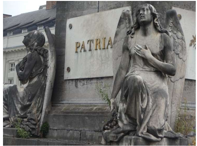
De crypte en een deel van het monument Pro Patria van Guillaume Geefs.