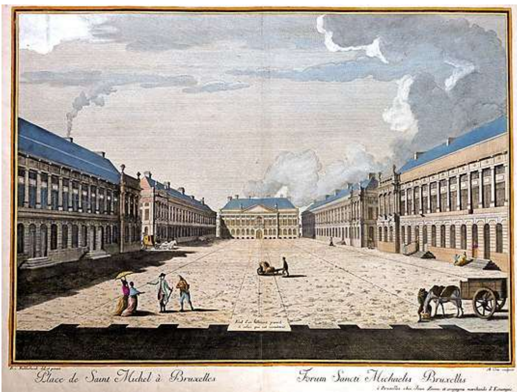
Het St-Michiels plein : gravure met aquarelverf van Amboise Orio, naar een tekening van Bernard Ridderbosch, 1783.

In 1776 verkreeg Ignez Vitzthumb, directeur van de Muntshouwborg, de toelating om een « mobiel theater » op te richten op het plein: een kleine, lichte, demonteerbare constructie waar hij Nederlandstalige stukken kon opvoeren. Het project was verlieslatend en liep uit op de verkoop van het theater in 1777. In 1795, tijdens de Franse Revolutie, werden de benamingen van de straten en pleinen met religieuze connotatie gewijzigd en het plein kreeg de naam van Blekerijplein , refererend naar de oude gebruiken op het plein.