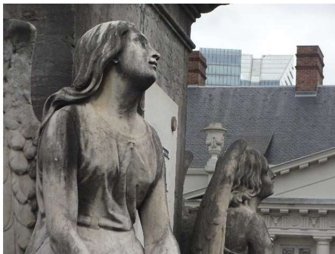
Het monument Pro Patria van Guillaume Geefs en detail.