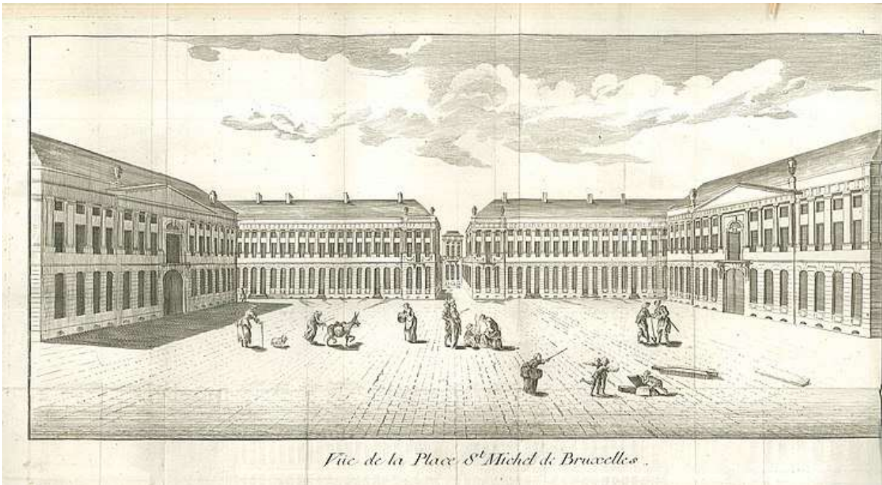
Het St-Michielsplein in Description de la ville de Bruxelles enrichie du plan de la ville et de perspectives , 1782. (Beschrijving van de stad Brussel met het plan van de stad en de vooruitzichten).