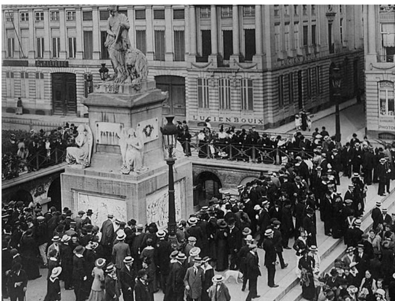
21 juli 1915: bijeenkomst rond het monument tijdens de Duitse bezetting naar aanleiding van de nationale feestdag.

In de loop der jaren waren er soms politieke manifestaties op het plein. Zo hebben op 23-09-1884 drieduizend socialisten een nationale herdenking verstoord door het zingen van « La Marseillaise » en « La Carmagnole ». De leiders van de manifestatie – Jean Volders en Louis Bertrand – werden aangehouden. Tijdens W.O. I werden vaderlands-lievende manifestaties verboden. Toch verzamelde de bevolking zich spontaan op het plein als teken van protest tegen de Duitse bezetting.