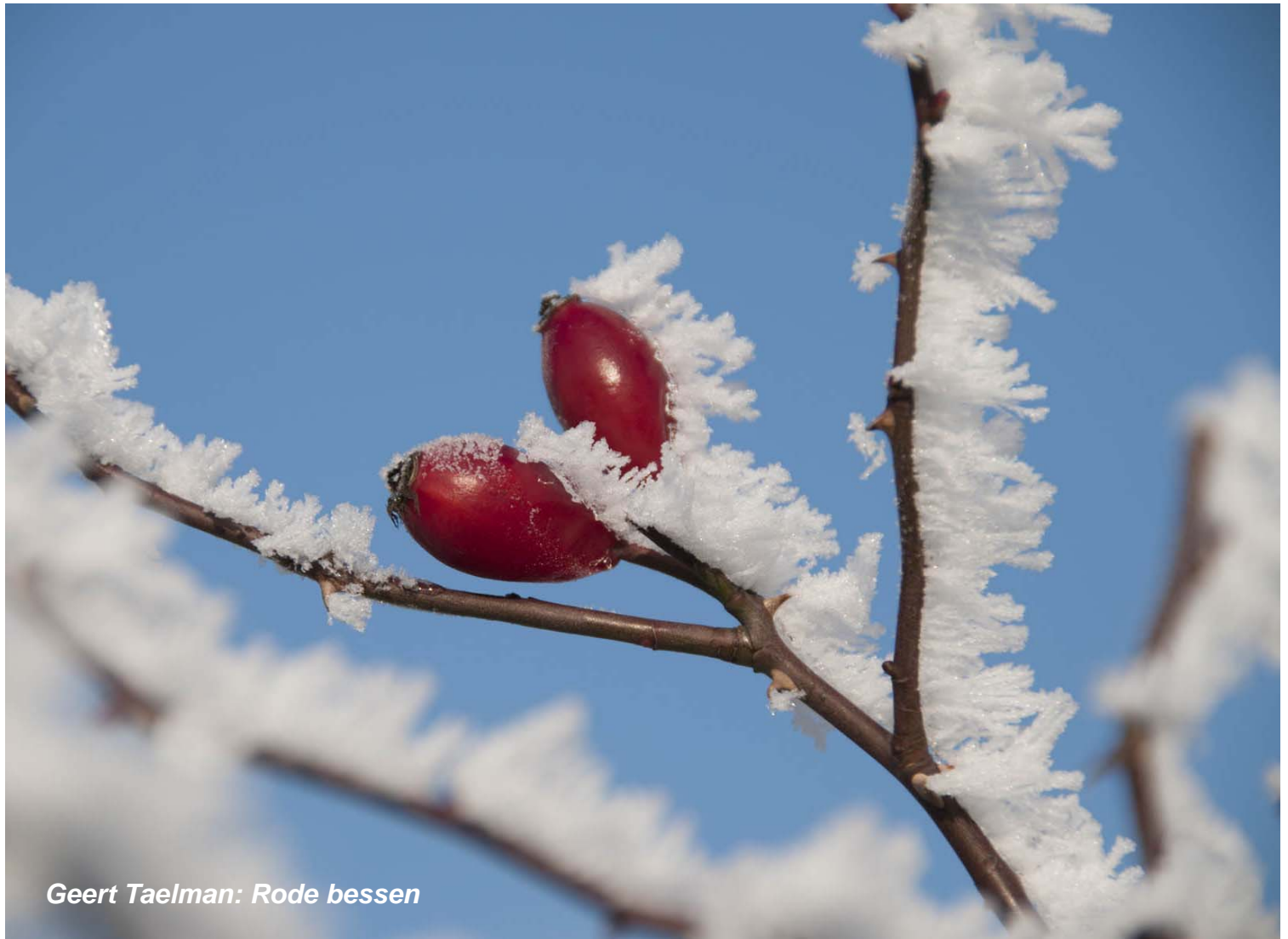
Geert Taelman: Rode bessen