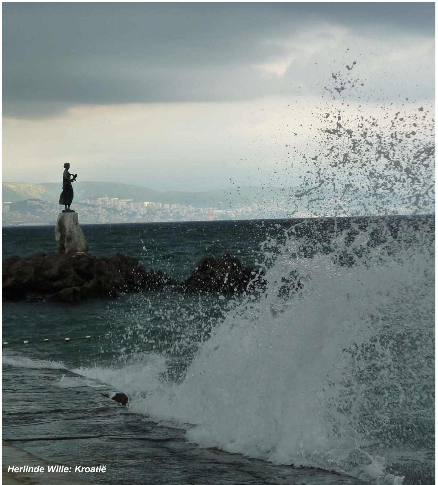
Herlinde Wille: Kroatie