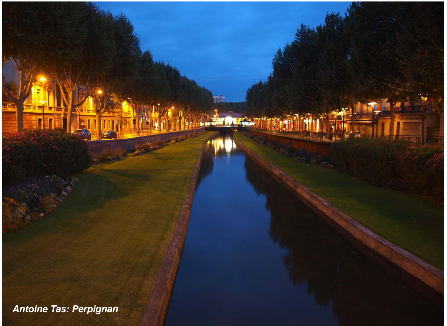
Antoine Tas: Perpignan