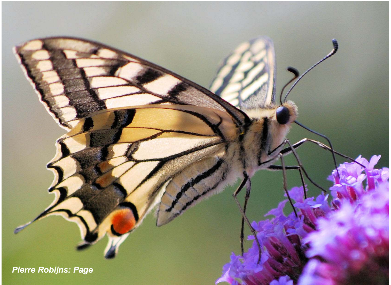
Pierre Robijns: Page