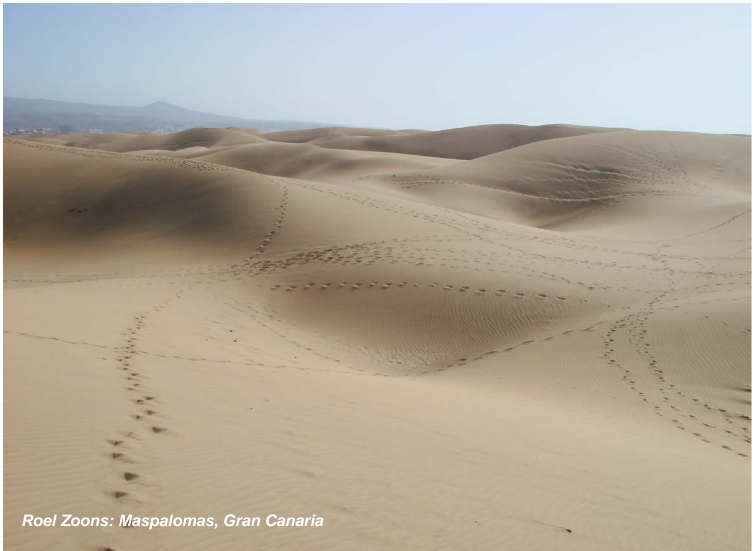
Roel Zoons: Maspalomas, Gran Canaria