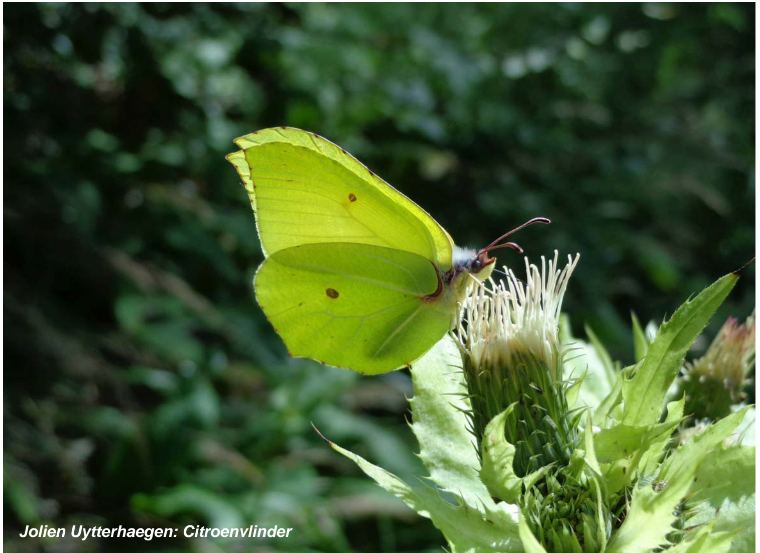
Jolien Uytterhaegen: Citroenvlinder