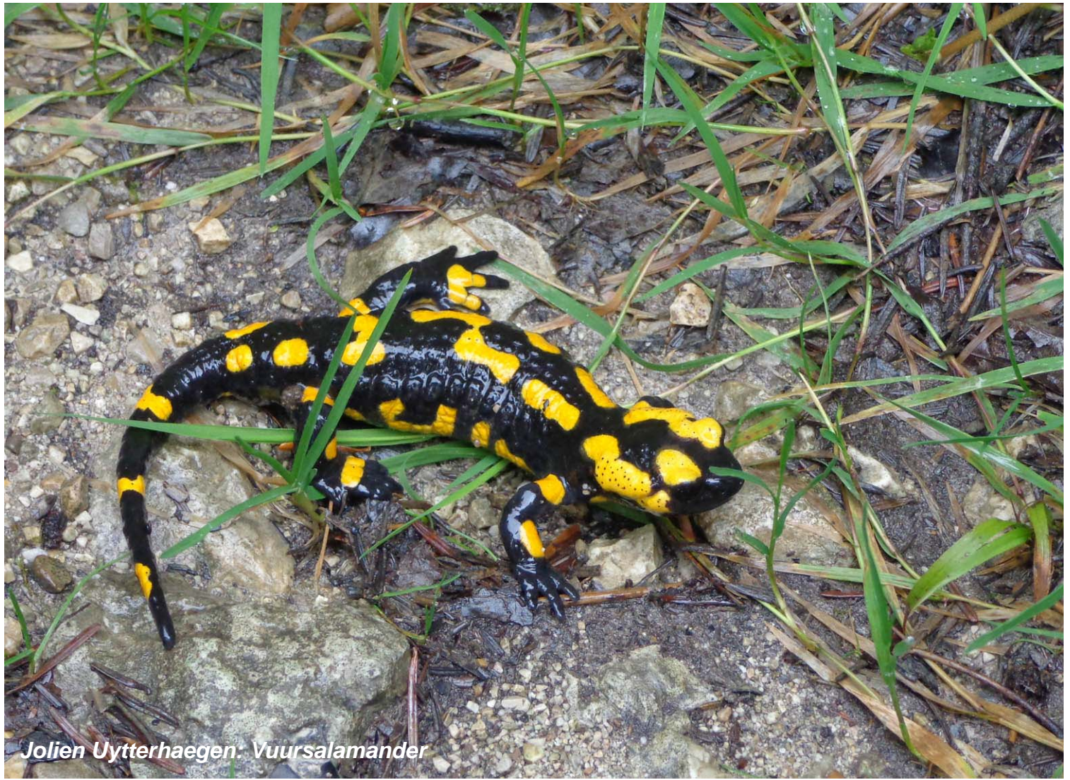
Jolien Uytterhaegen: Vuersalamander