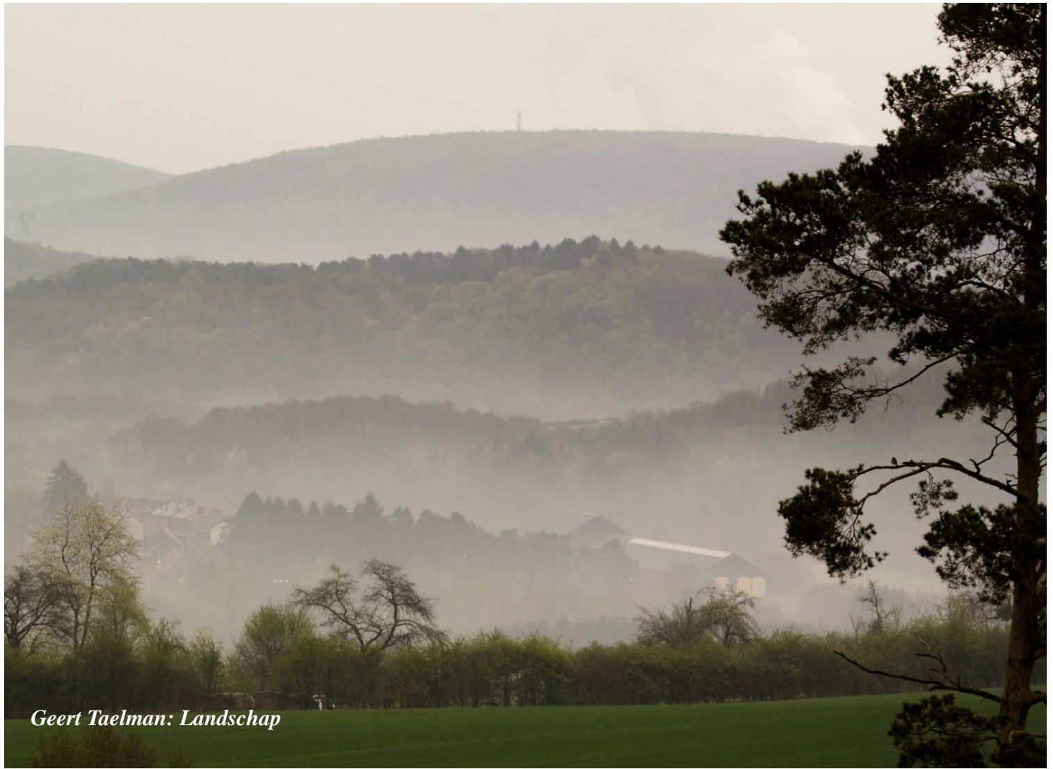
Geert Taelman: Landschap