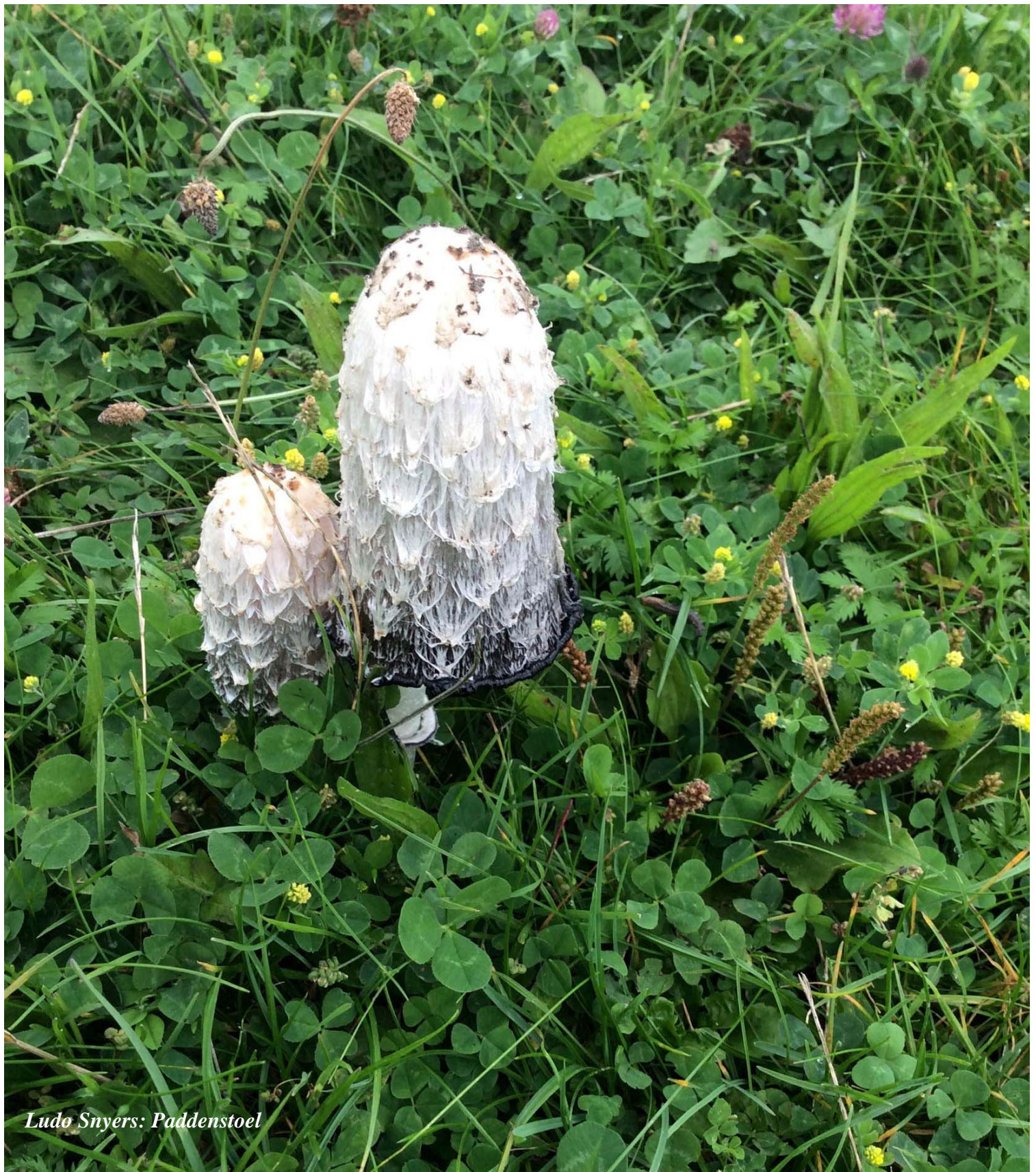
Ludo Snyers: Paddenstoel